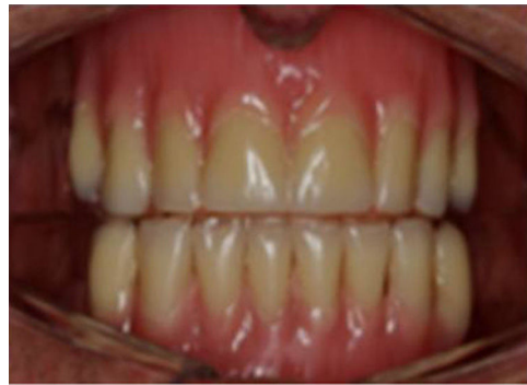
Figura 1 – Aparelho duplo com dentes, somente para efeito estético, assentado diretamente sobre o rebordo alveolar.

Para os voluntários com próteses sem retenção, foram feitas moldagens do rebordo residual pela técnica convencional