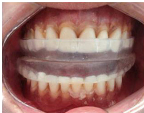
Figura 3 – Aparelho duplo assentado diretamente sobre próteses.

Os voluntários foram orientados a permanecerem em pé, relaxados e com a cabeça em posição natural, não forçada.