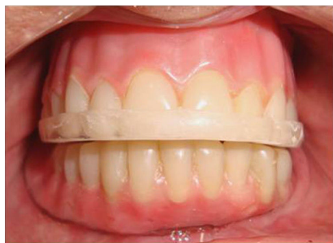
Figura 2 – Aparelho monomaxilar assentado diretamente sobre a prótese superior.

evitar báscula durante os movimentos mandibulares. Nos aparelhos monomaxilares, o número mínimo de pontos de contato com os dentes antagonistas foram 3, 2 bilaterais posteriores e um na região anterior. Nos duplos, buscou-se a maior área de contato entre as superfícies oclusais dos aparelhos.