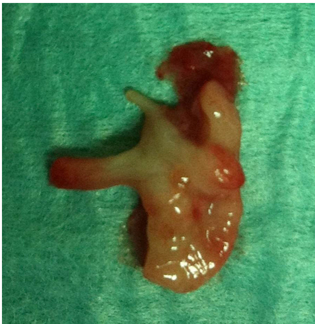
Figura 3 Peça operatória. A seta indica um pólipo intraureteral.

mesodérmica, que correspondem a projeções da mucosa compostas por estroma fibroso coberto por urotélio 2 , que podem ocorrer em todo o aparelho urinário. A localização mais comum destes pólipos é a JPU e o ureter proximal, seguidos da uretra posterior e do ureter médio e distal 3 . Outros tumores benignos menos comuns são os leiomiomas, papilomas, hemangiomas, linfangiomas, granulomas ou fibromas. São mais frequentes no sexo masculino e do lado esquerdo 3-5 . Podem ser únicos ou, mais frequentemente, múltiplos 6 .