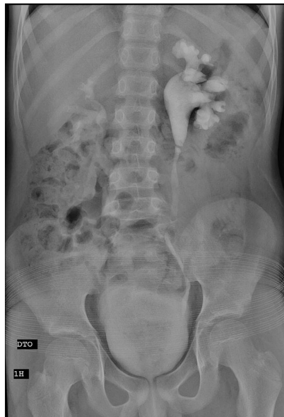
Figura 1 Urografia endovenosa mostra uma imagem de subtração transversal ao nível da JPU.

O doente foi proposto para pieloplastia desmembrada aberta. Intraoperatoriamente, constatou-se a existência de obstrução intrínseca da JPU pela presença de 2 pólipos ao nível do ureter proximal (figs. 2 e 3). Foi efetuada pieloplastia desmembrada segundo a técnica de Anderson-Hynes